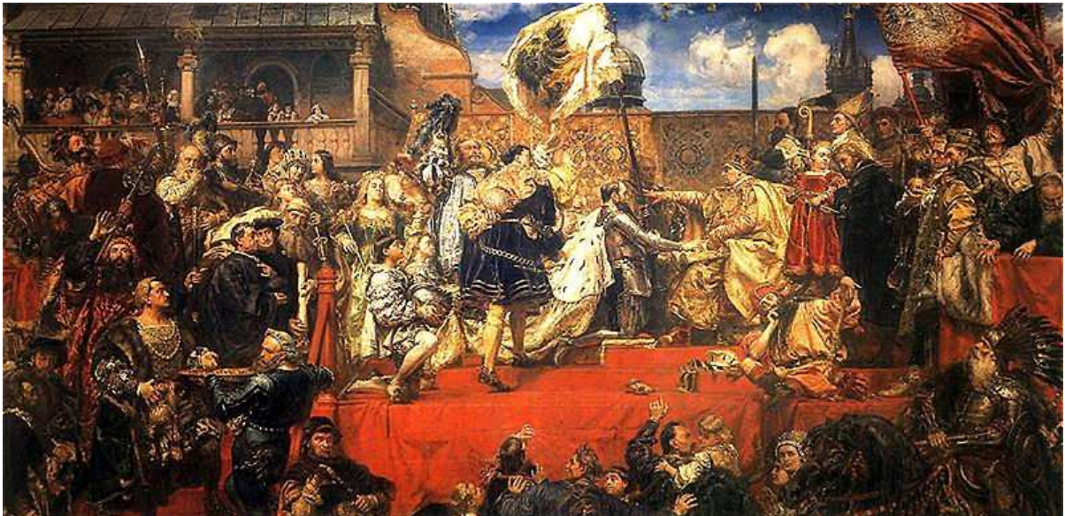
HÓŁD PRUSKI 1466