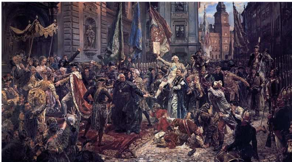
KONSTYTUCJA 3 MAJA 1891