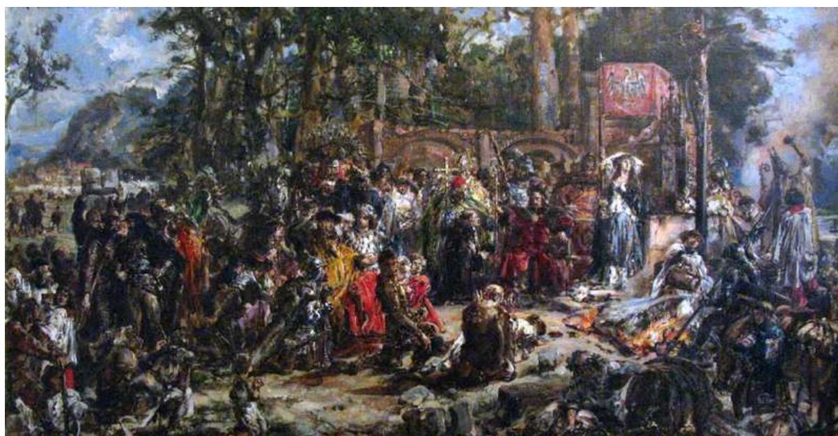
CHRZEST LITWY 1889