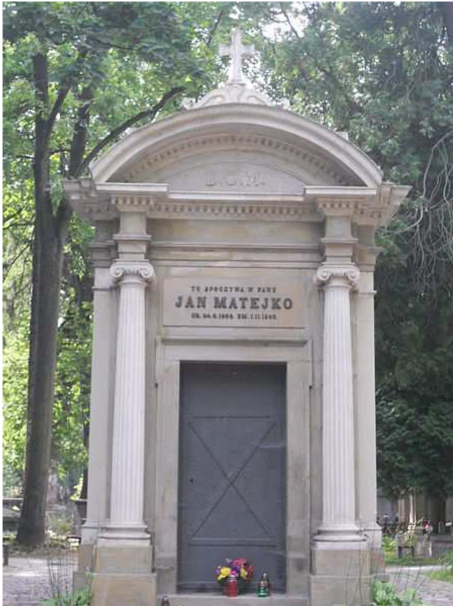
Grobowiec artysty na krakowskich Rakowicach

Jan Matejko w młodości przeżył bombardowanie Krakowa przez Austriaków w 1848 r. oraz Powstanie Styczniowe. Pod wpływem narodowych klęsk postanowił porzucić malarstwo religijne, które uważał za swoje powołanie, i poświęcił się prawie wyłącznie malarstwu historycznemu. Sama historia była jego obsesją. Nie potrafił o niej pisać ani opowiadać, więc ją malował. Zarzucano mu swobodne podejście do historii. Sam Matejko traktował swoje obrazy jako głos w polemice dotyczącej przeszłości i przyszłości kraju, a nie wyraz ideologii. Drugą pasją Matejki był kraj. Był on zagorzałym patriotą. Dofinansowywał miasto, biednych i kulturę pokazując swoje obrazy za darmo lub przekazując je państwu. Prace jego były od tej pory analizowane w ramach przekazu ideowego.