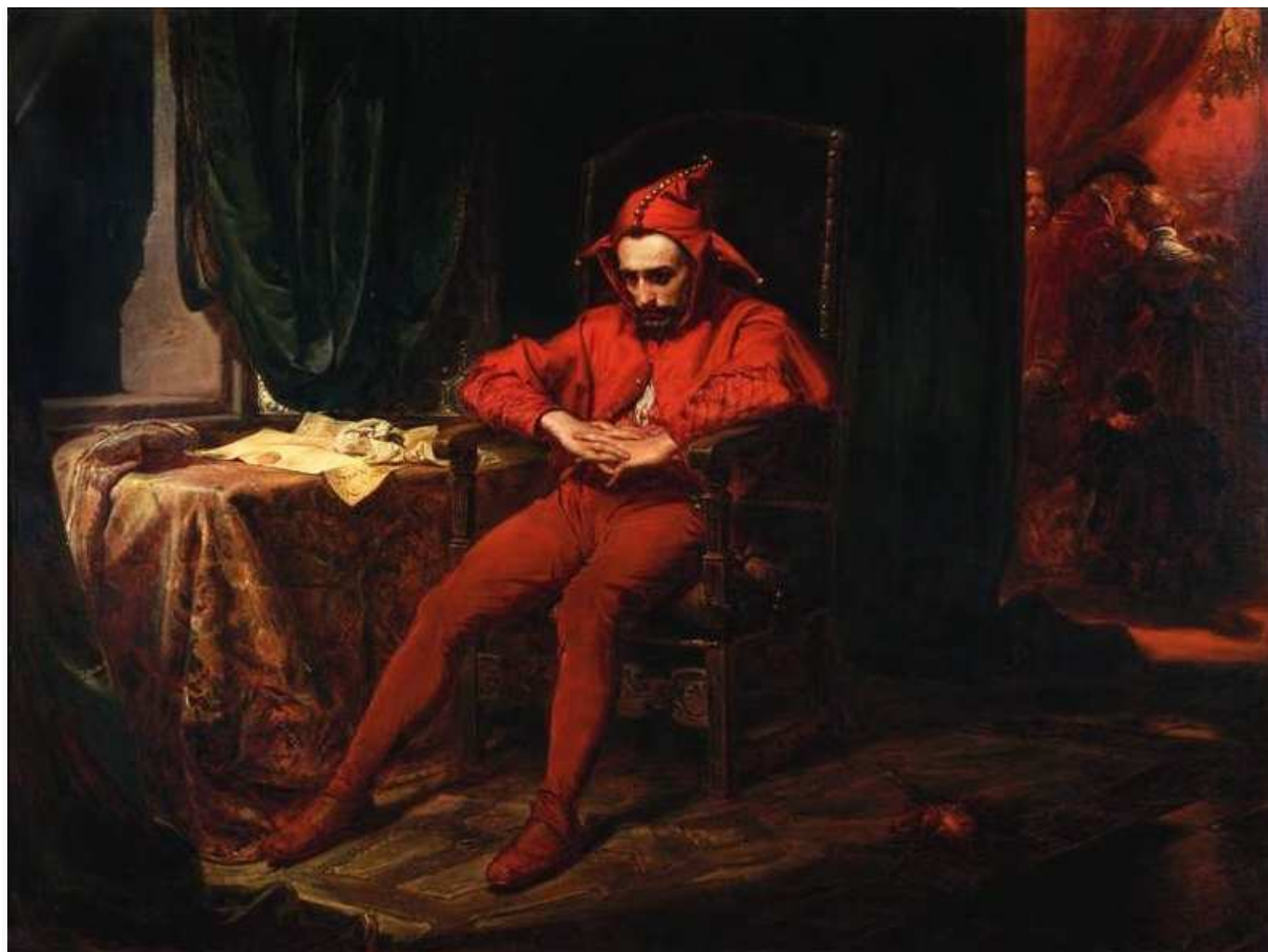
STAŃCZYK 1862 ( Stańczyk w czasie balu na dworze królowej Bony gdy wieść przychodzi o utracie Smoleńska )