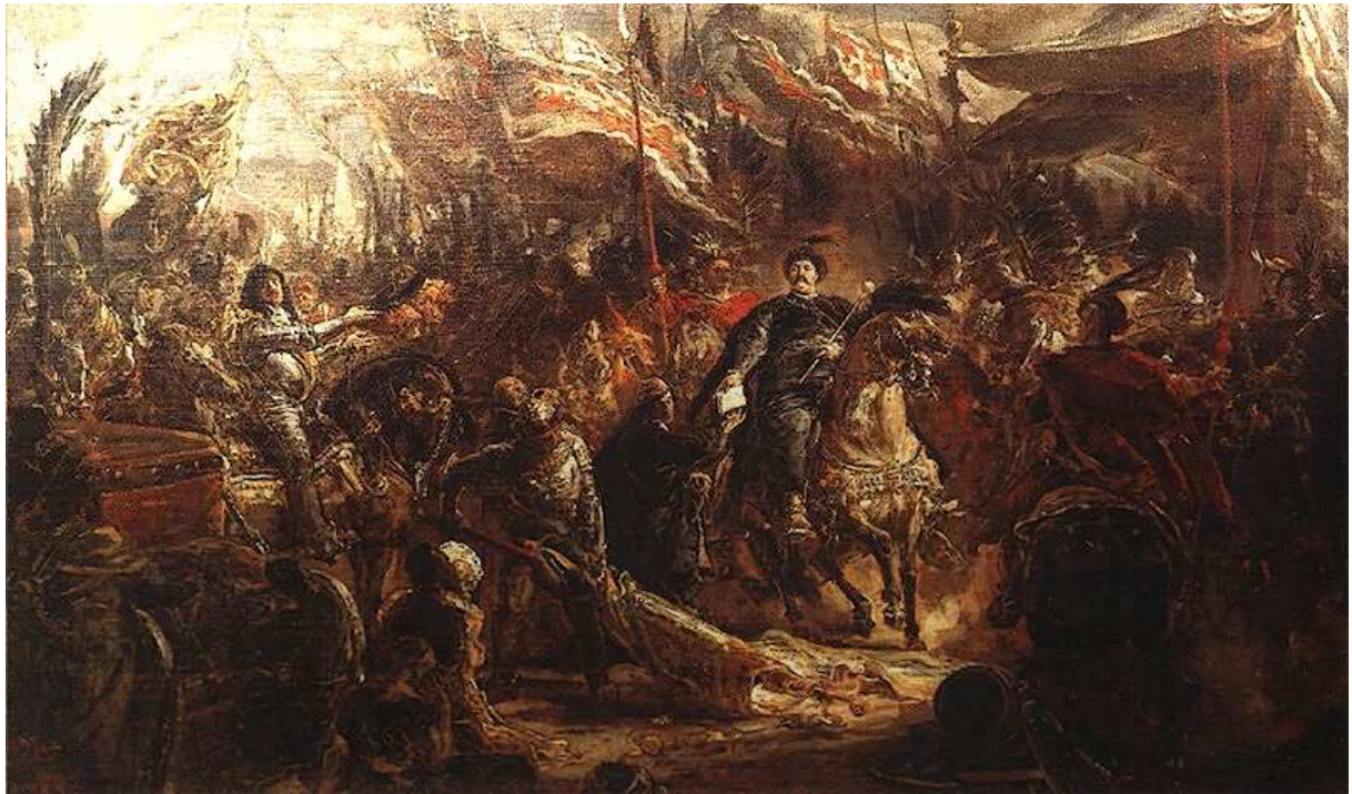
JAN SOBIESKI POD WIEDNIEM 1683