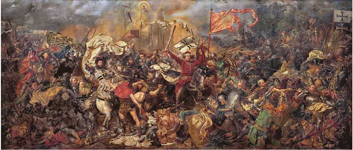
BITWA POD GRUNWALDEM 1410