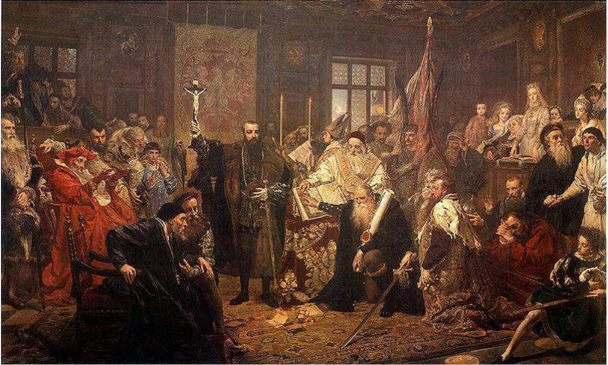
UNIA LUBELSKA 1569