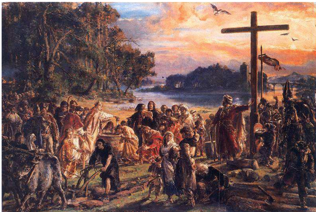
ZAPROWADZENIE CHRZEŚCIJAŃSTWA 1889