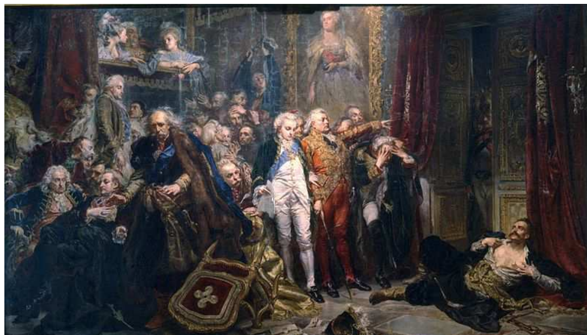
REJTAN – UPADEK POLSKI 1866