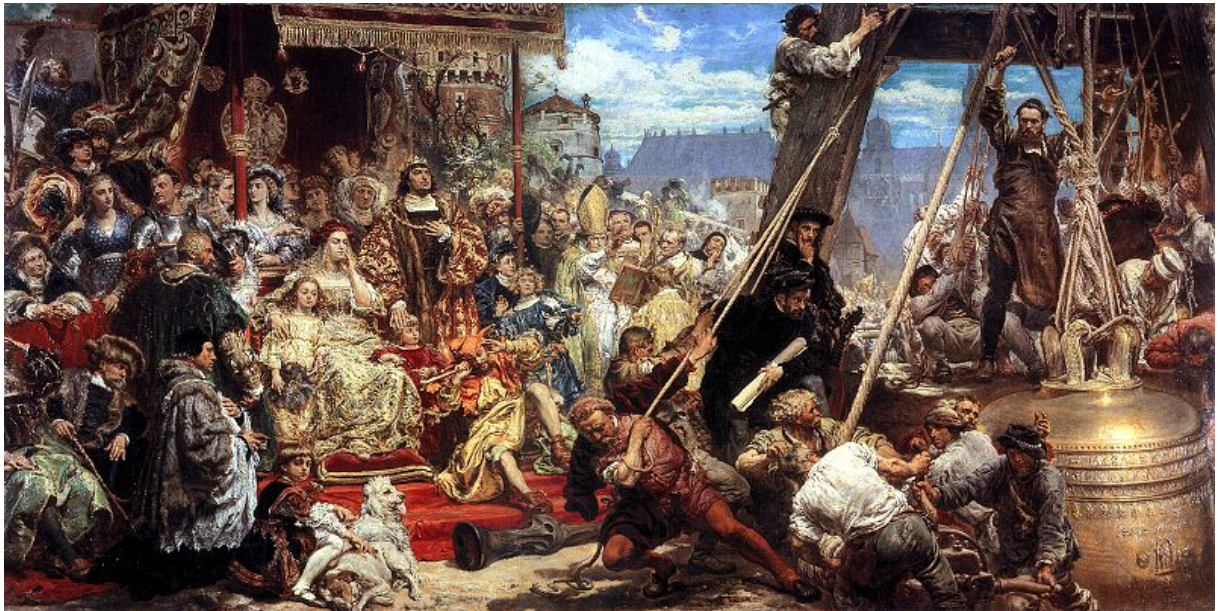
ZAWIESZENIE DZWONU ZYGMUNTA 1874