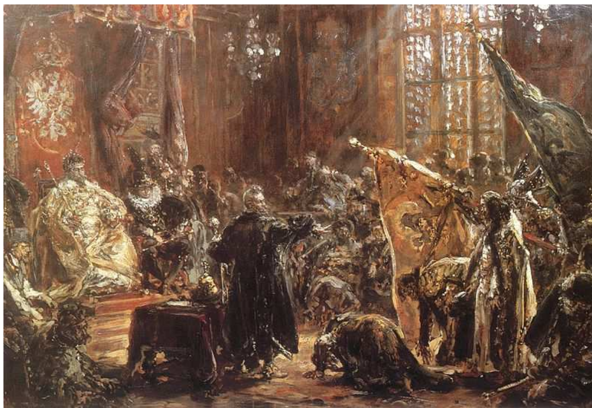
CAROWIE SZUJSCY PRZED ZYGMUNTEM III 1892