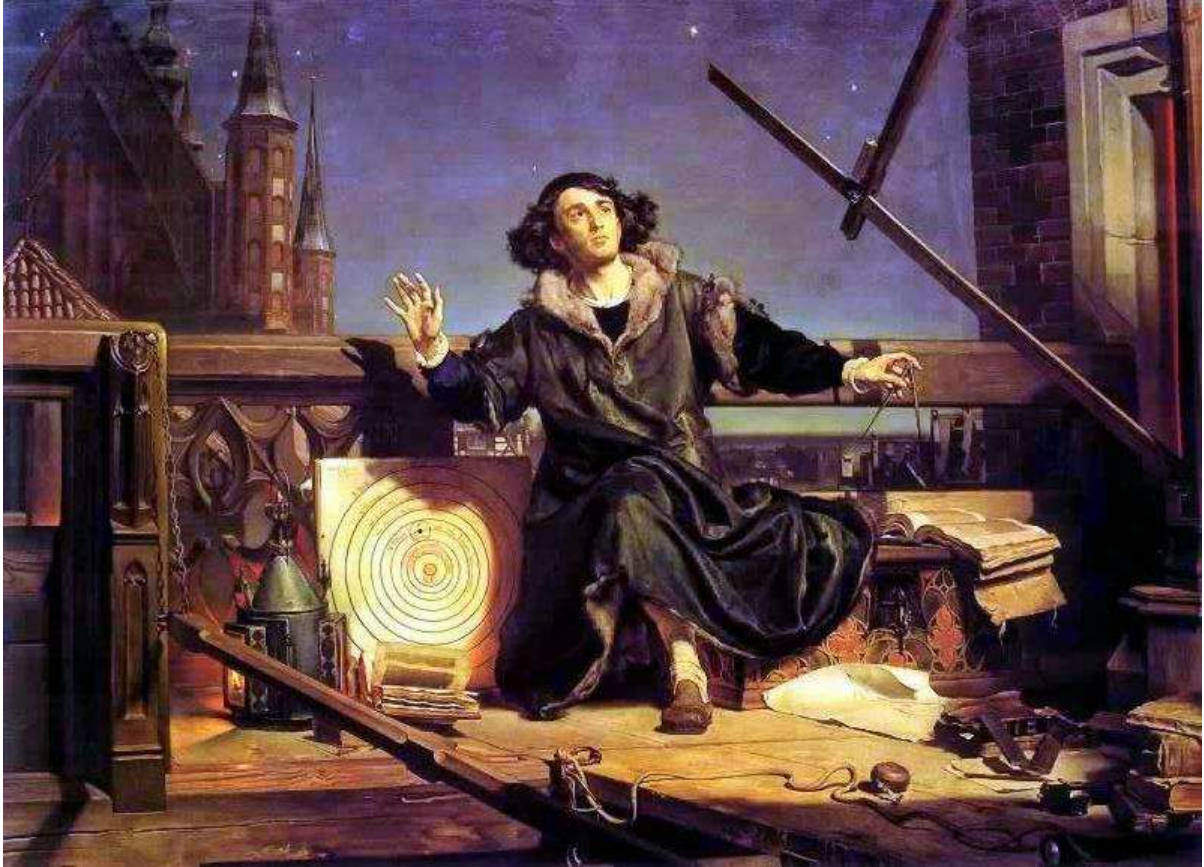
ASTRONOM KOPERNIK CZYLI ROZMOWA Z BOGIEM 1873