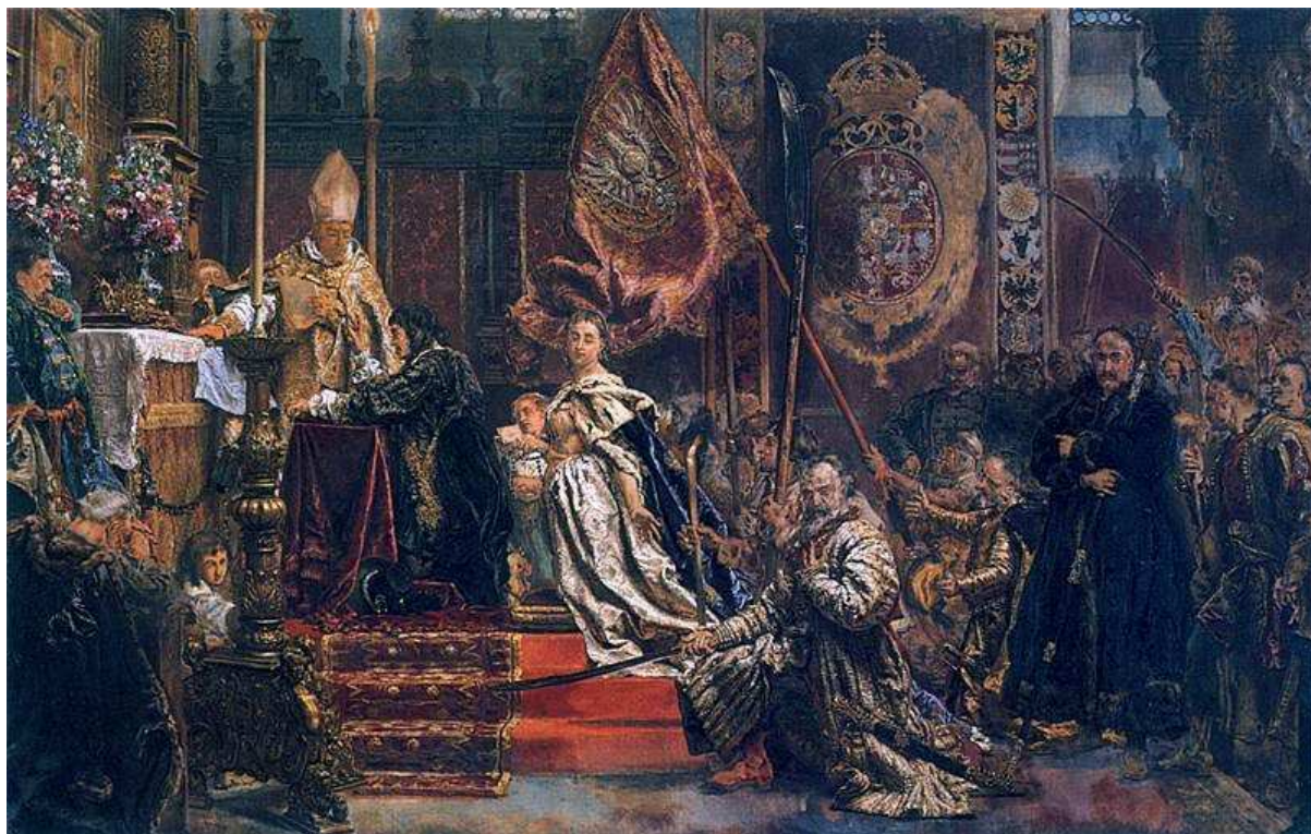
ŚLUBY JANA KAZIMIERZA 1893