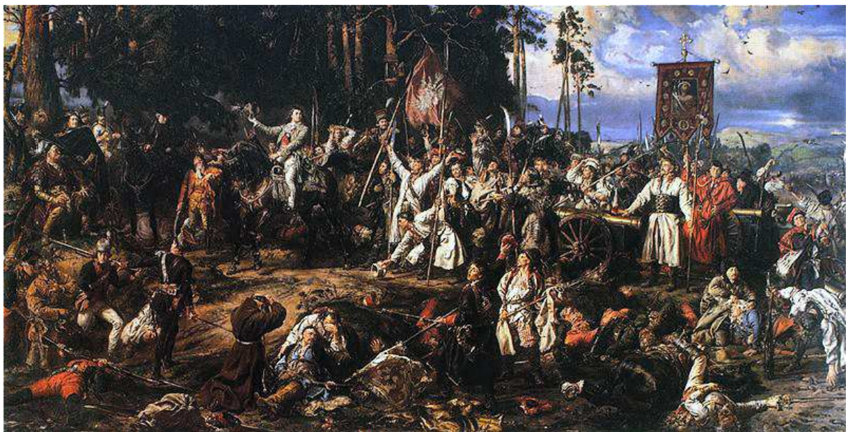
KOŚCIUSZKO POD RACŁAWICAMI 1794