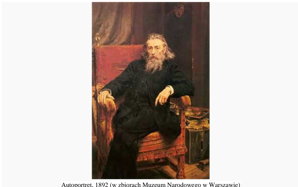
Autoportret, 1892 (w zbiorach Muzeum Narodowego w Warszawie)