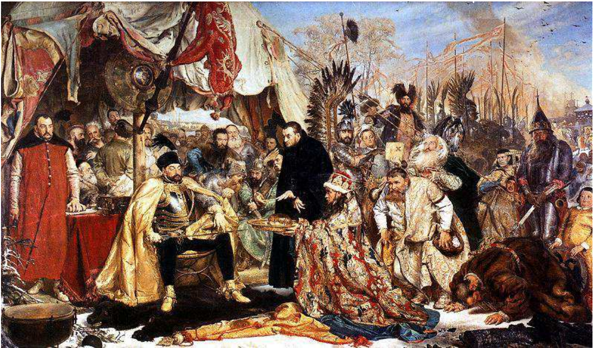
STEFAN BATORY POD PSKOWEM 1572