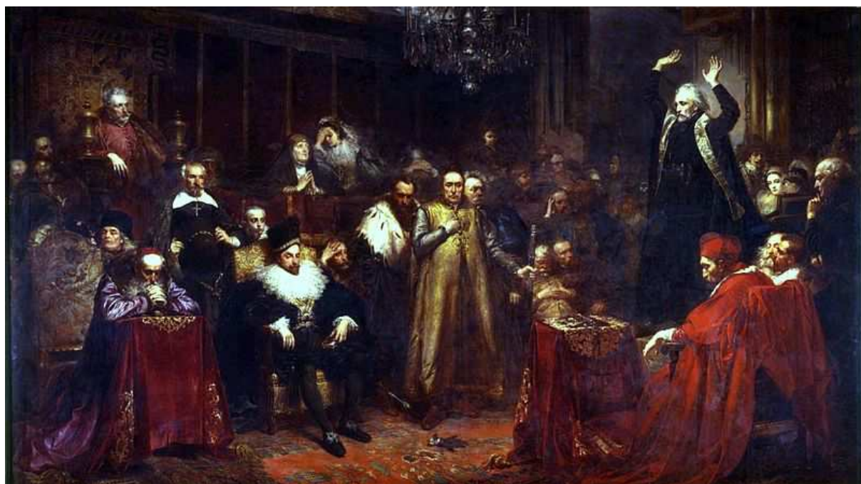
KAZANIE SKARGI 1864