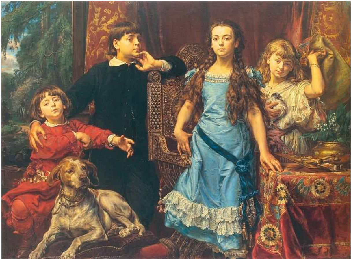
Portret dzieci artysty, 1879

22 stycznia 1863 roku jego dwaj bracia przyłączyli się do Powstania Styczniowego. Jan nie poszedł, ponieważ nie potrafił posługiwać się bronią i źle widział. Woził natomiast broń i pomagał powstańcom materialnie.